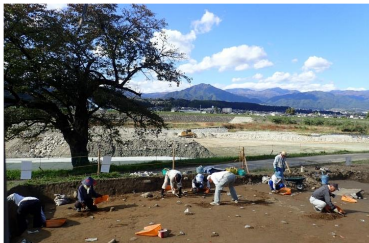
川原遺跡 2 区の調査