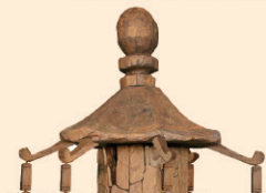
木造六角宝櫃 (11~12世紀) 長野県宝