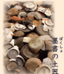
墨書 ぼくしょ の土器