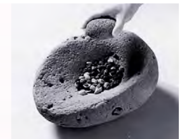
磨石と石皿の使用例