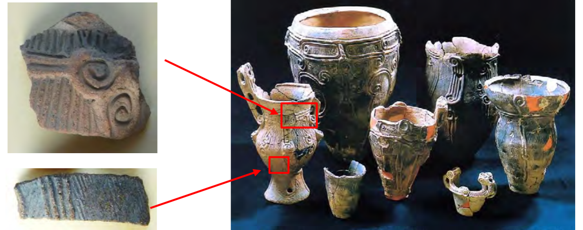
『熊久保遺跡第10次発掘調査報告書』朝日村教委 2003より

熊久保遺跡から出土した土器と同じように土器の表面に粘土の紐をはり付けて、渦巻、直線、曲線などを表現した土器が、この遺跡でも出土しています。