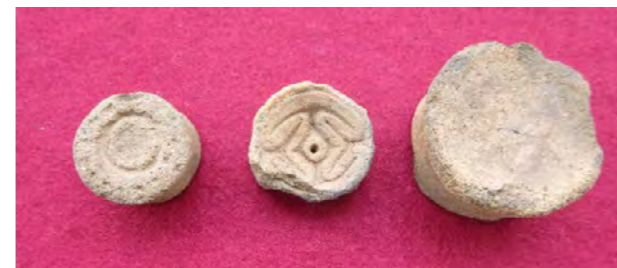
写真中央のもので直径約3cm

耳たぶに穴をあけてピアスのように使用したと考えられます。文様のあるものとないものがあります。