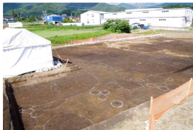
山鳥場遺跡で発見した縄文時代の生活痕跡（白線の範囲）

朝日村には、山鳥場遺跡の中心となる時期（縄文時代中期）とほぼ同時代の くまくほいせき 熊久保遺跡の発掘調査が行われています。この遺跡は山鳥場遺跡から直線距離で西へ約1.5km離れた場所（鎖川を挟んだ対岸・朝日村美術館付近）に位置し、堅穴住居跡は約100軒もみつかっています。今後、両遺跡の調査成果を検討することで、朝日村における縄文時代のムラ同士の交流が明らかになると考えています。