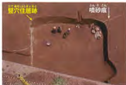
承和地震と思われる噴砂痕 (長野市篠ノ井遺跡群)