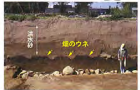
仁和の洪水砂で埋没したと思われる燵 (佐久市砂原遺跡)