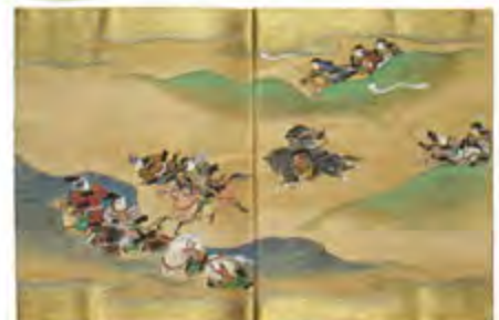
「平家物語絵巻」横田河原合戦 源(木曾)義仲が平家を破る(長野市篠ノ井横田)