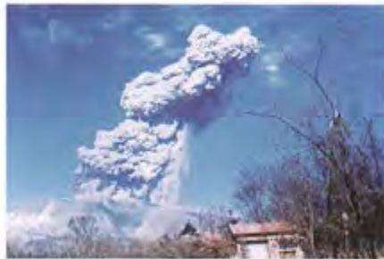
浅間山の噴火 (1958年の中爆発)