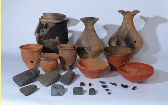
竪穴住居跡から出土した土器と石器

もりだいら たてあな 森平遺跡 の竪穴住居跡には、土器や石器がまとめて捨てられた場所がありました。写真後方は、そうした場所から出土した弥生時代中期(約2000年前)の土器です。また、木を切る斧(おの ふとがたはまぐりほせきふ ・写真左前)と木を削る道具(へんぺいかたば みが )、磨いて作った石鏃(磨製石鏃・右前)がみつかりました。