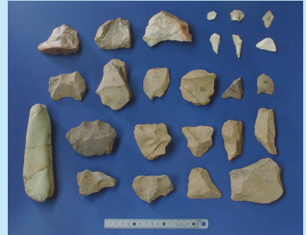
竹佐中原 C 地点の石器

2005 年度調査では、新たに C 地点(429 点)と D 地点(8 点)の石器群が発見され、C 地点の石器は、A 地点の石器とともに「国内最古級」と報道されました。調査が進み、D 地点から後期旧石器時代に見られる斧形石器が出土したことにより、A 地点や C 地点の石器も後期旧石器時代のものであるとする、これまでとは異なった意見が出てきました。A ～ D 地点の石器は同じ文化のものなのか。竹佐中原遺跡で何が行われ、それはいつのことであったのか。などは深まるばかりです。しかし、竹佐中原遺跡の石器が、旧石器捏造事件でかき消された日本史の第一頁を書き直すための重要な資料であることは確かなことです。