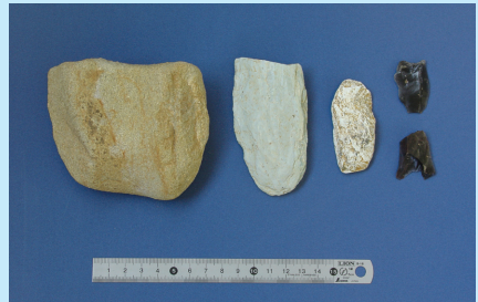
竹佐中原 D 地点の石器