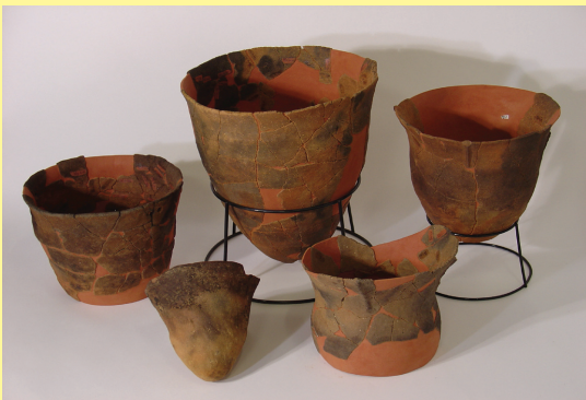
駒形遺跡の縄文土器

こまがた 駒形遺跡 では、約6000年前(縄文時代前期)に使われた縄文土器が多くみつかりました。多くのものは底が尖っていて、そのままでは地面に置けません。石などで固定して使っていたのでしょう。また、関東や東海地方の土器がみられ、縄文人の交流範囲をうかがうことができます。交流の背景に、黒曜石の交易があったと考えられます。