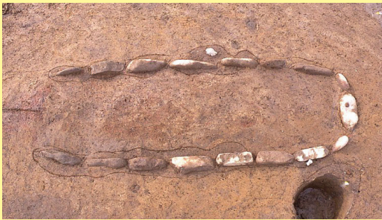
縄文中期の大型石囲い炉

せんた 千田遺跡 で縄文中期後半の竪穴住居跡につくられた石囲い炉です。千曲川から運んだ人頭大よりやや小さい石をコの字形に埋め込んでいます。内側の掘り込みは浅く、焼土が残っています。新潟県にあるタイプで、長軸1.9mもあり、長さは長野県最大の石囲い炉とされます。