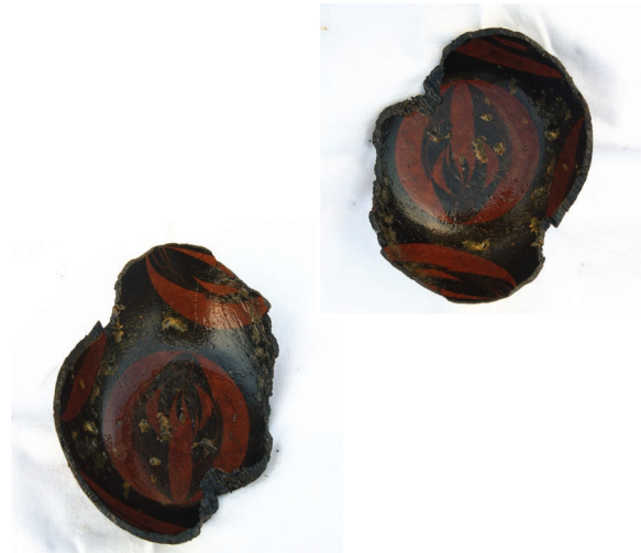
東條遺跡出土の漆椀