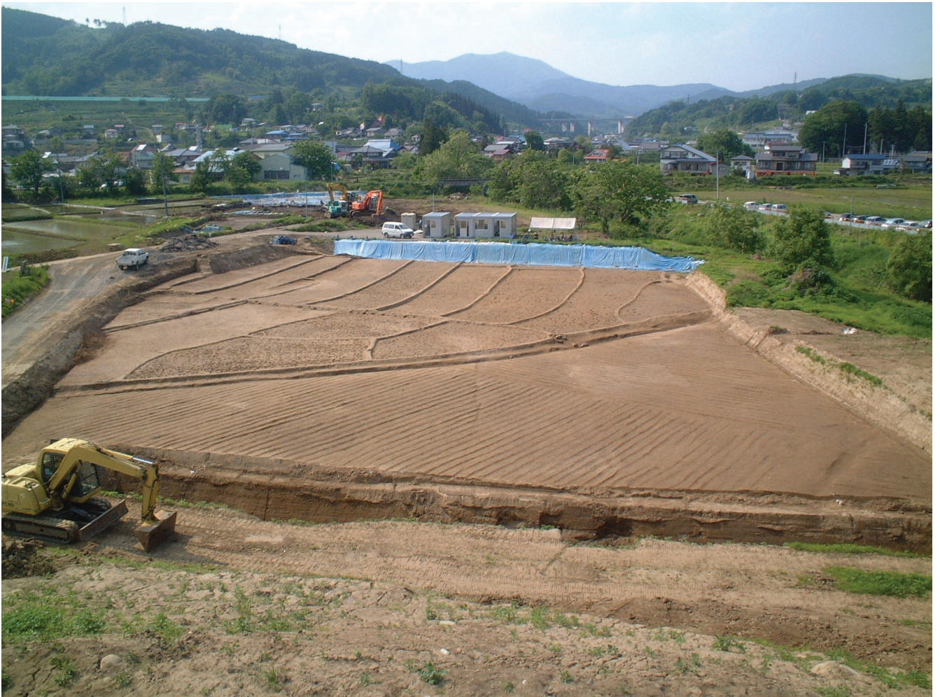
地下約 1.5m で見つかった江戸時代の水田と畑跡（千田遺跡）