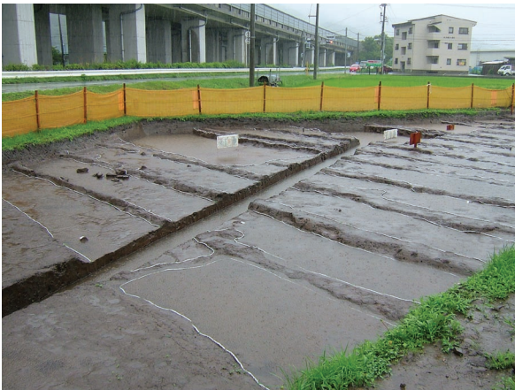
洪水で水没した水田跡

水田と言えば、「畦」でかこまれたなか（「田面」）に稲が植えられている風景が一般的です。水田耕作では「畦」と「田面」は毎年作り直されるので、今年とまったく同じ姿の水田を来年見ることはできません。似た風景が見えるに過ぎないのです。ところが、ある日、洪水などの自然災害により水田が砂で埋まった場合、その水田は後の耕作で壊されなくなります。ですから、洪水に見舞われた場所ほど、地下に水田がよく残っているわけです。千田遺跡・西一里塚遺跡・御社宮司遺跡で発見された水田跡は、洪水砂の下に良好な状態で眠っていたものです。当時の人々の災難が今日の水田跡研究の発展に大きく寄与しているのですから、皮肉なものです。