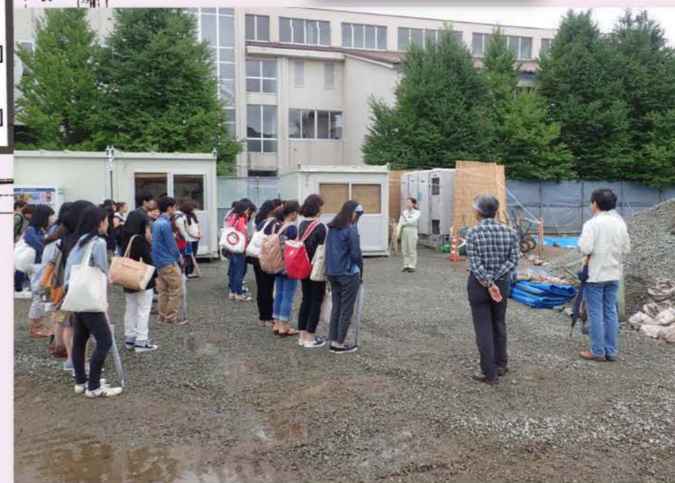
県短生の遺跡見学