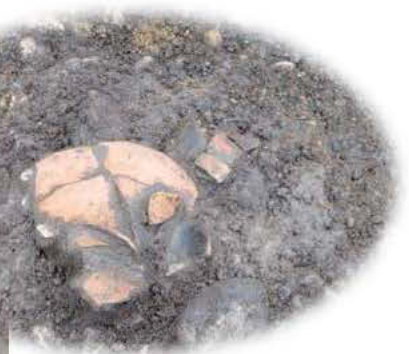
床面近くから出土した吉田式土器の壺