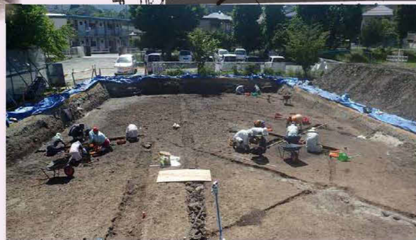
グラウンド西側の調査