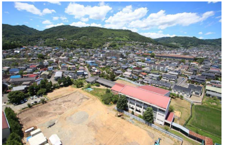
長野県短期大学上空から飯縄山方向を望む

その中でも短大周辺には、短大の北側300mに「 ほんむらひがしおき 本村東沖遺跡」、東側300mに「 しもうきびー 下宇木B遺跡」、南側300mに「三輪遺跡」などがあり、発掘調査が行われています。今回、発掘を行った短大の場所は「 ほんむらみなみおき 本村南沖」の字名があり、「本村南沖遺跡」と呼ぼうと考えています。