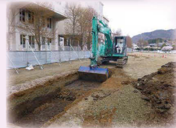
グラウンド下を掘る