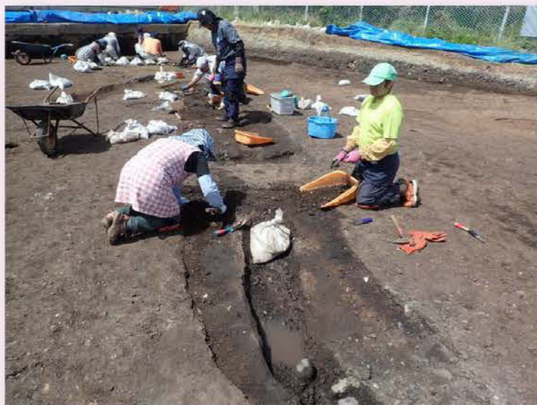
幼稚園舎北側の調査