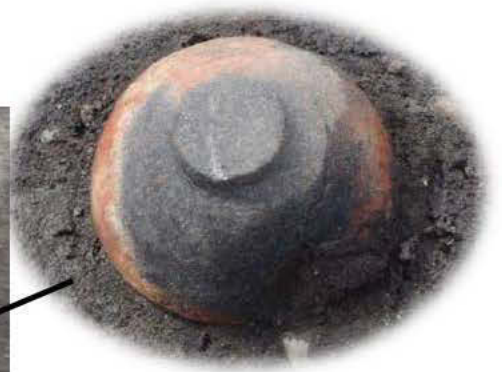
床面からほぼ完全な形で出土した鉢