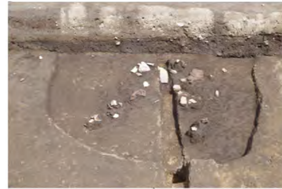
発掘した たてあな 竪穴住居跡 縄文時代中期 (約 5,000 年前)