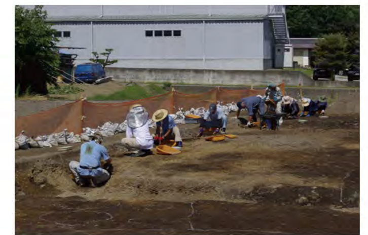
猛暑の中を発掘中