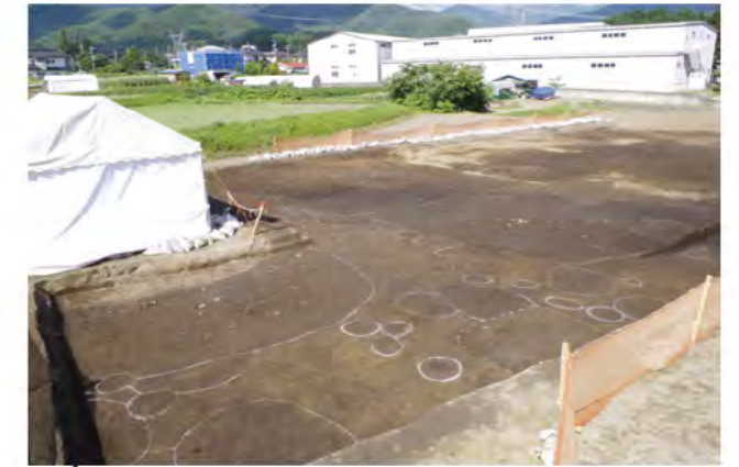
縄文時代中期のムラを発見 (約 5,000 年前)