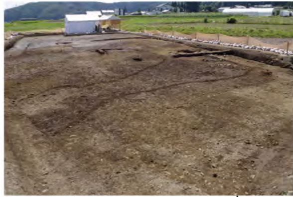
土石流の痕跡 縄文時代後期～晩期 (約 3,000～4,000 年前)