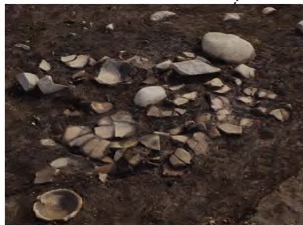
土器が集中して出土 縄文時代後期～晩期 (約 3,000～4,000 年前)