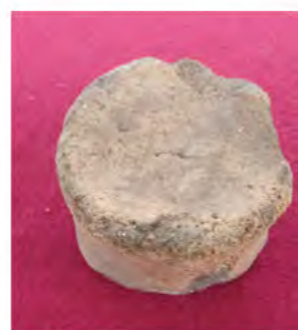
耳飾り 縄文時代晩期 (約 3,000 年前)