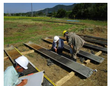
抜き取り試料の観察・実測