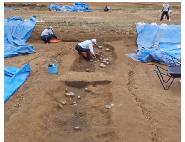
南北に延びる溝跡 (SD2)