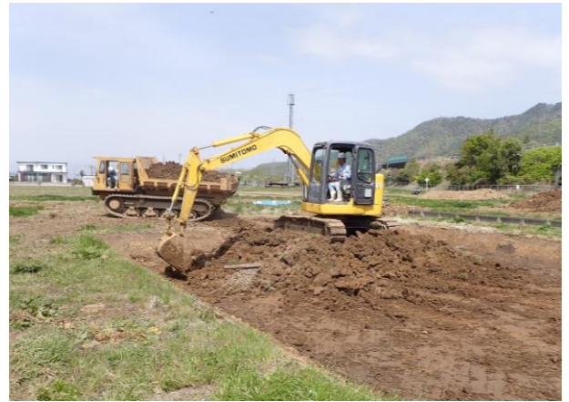
重機による表土剥ぎ業

本年度の調査区は、スマートインターチェンジの調整池に相当する部分で、地表下2mまで掘削を伴う地形改変等の影響が及ぶため、その深さまでを記録保存調査の対象としています。現道をはさんで高速道路側をA区、川田小学校側をB区とし、崩落防止等の安全面に配慮し、現道から10m離れた場所にそれぞれ3カ所調査区を設定し、調査を進めています。