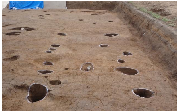
ほったてばしらたてものあと 掘立柱建物跡 (ST1)

今後、溝跡を中心に掘り下げていきます。どんなお宝が埋まっているか、乞うご期待です。