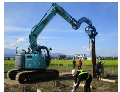
ジオスライサー打ち込み作業

調査区内4か所に設定した延長20m程度の直線4本に各10地点、これに1地点を加えて計41地点で、鋼矢板を杭打機で打設する地層抜き取り調査(ジオスライサー掘削法)を実施しました。地表下4mまで打ち込み、厚さ10cmほど地層を抜き取り、採取した土層断面を現地でデジタルカメラで撮影し、画像処理を行った上で、地点ごとに柱状図を作成しました。また、層位ごとに年代測定等の科学分析に要するサンプルを採取し、分析を専門業者に依頼しました。その結果、今回の整備事業に伴う影響範囲には、高速道建設で面調査を実施した、古墳時代～奈良時代に比定される水田面が、少なくとも2面存在することがわかりました。