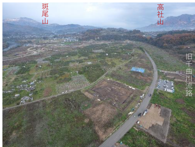
南上空からみた南大原遺跡（令和7年撮影）