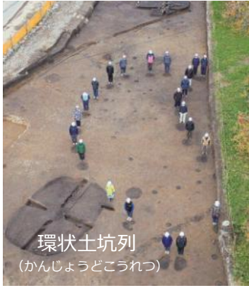
環状土坑列 (かんじょうどこうれつ)

弥生時代中期後半から後期の集落遺跡であることが明確になり、祭祀場と想定される環状土坑列がみつかりました。今回はここに隣接する北東側を調査します。