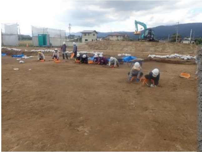
作業風景（遺構の確認作業）