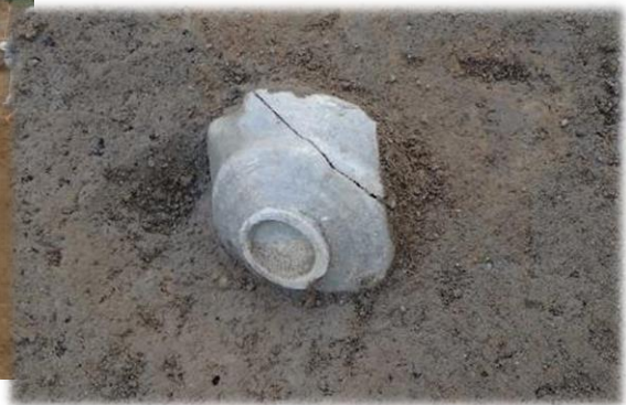
堀跡からみつかった陶器 (いずれも令和3年11月撮影)

令和3年10月より発掘調査を開始した長沼城跡では、中世から近世の長沼城跡に関わる堀跡や、陶磁器や銭貨などの生活道具がみつかっています。今回、現在の調査状況を地元のみなさんにご紹介する現地公開を下記のとおり開催いたします。