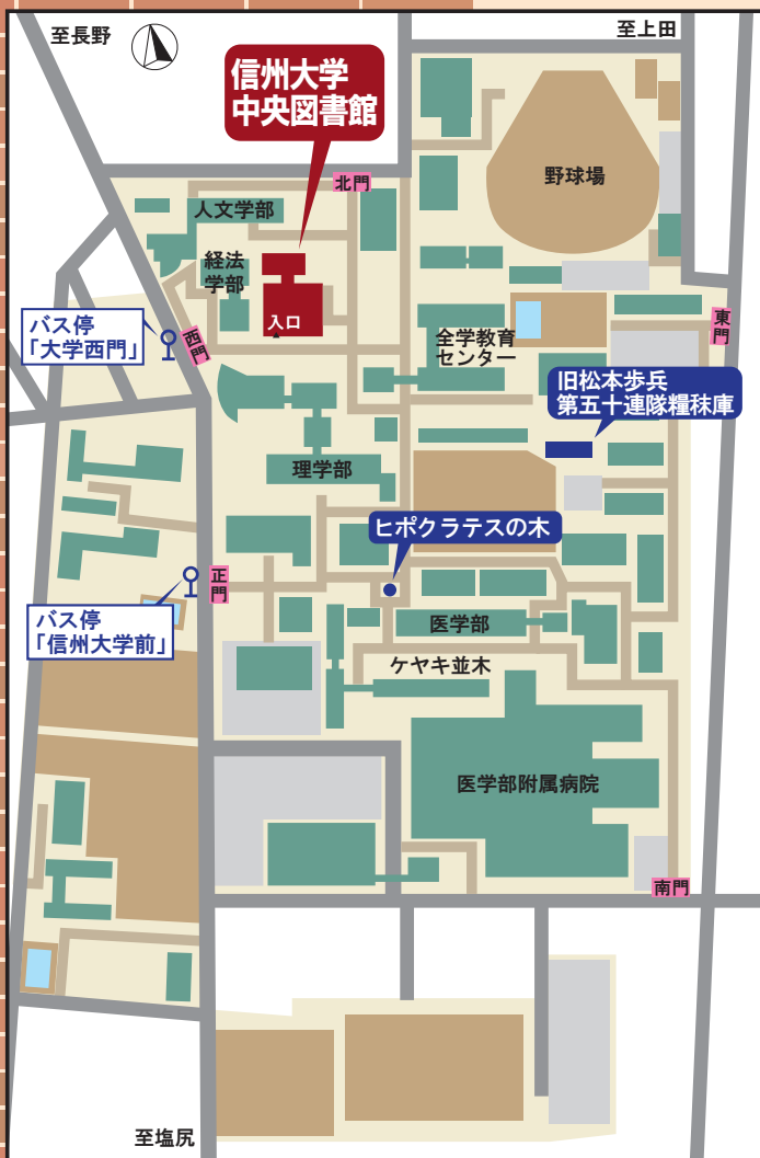
信州大学松本キャンパス