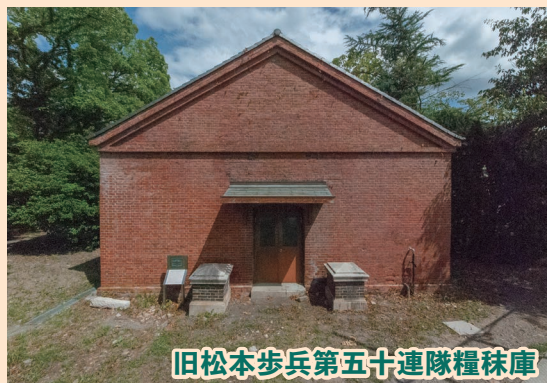
旧松本歩兵第五十連隊糧秣庫

戦後に松本医学専門学校が移転、資料室として使用。保管された資料の中には貴重な考古資料も含まれる。