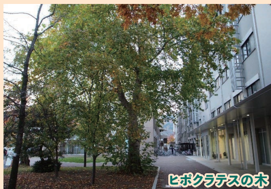
ヒポクラテスの木

戦後に松本医学専門学校が移転、資料室として使用。保管された資料の中には貴重な考古資料も含まれる。