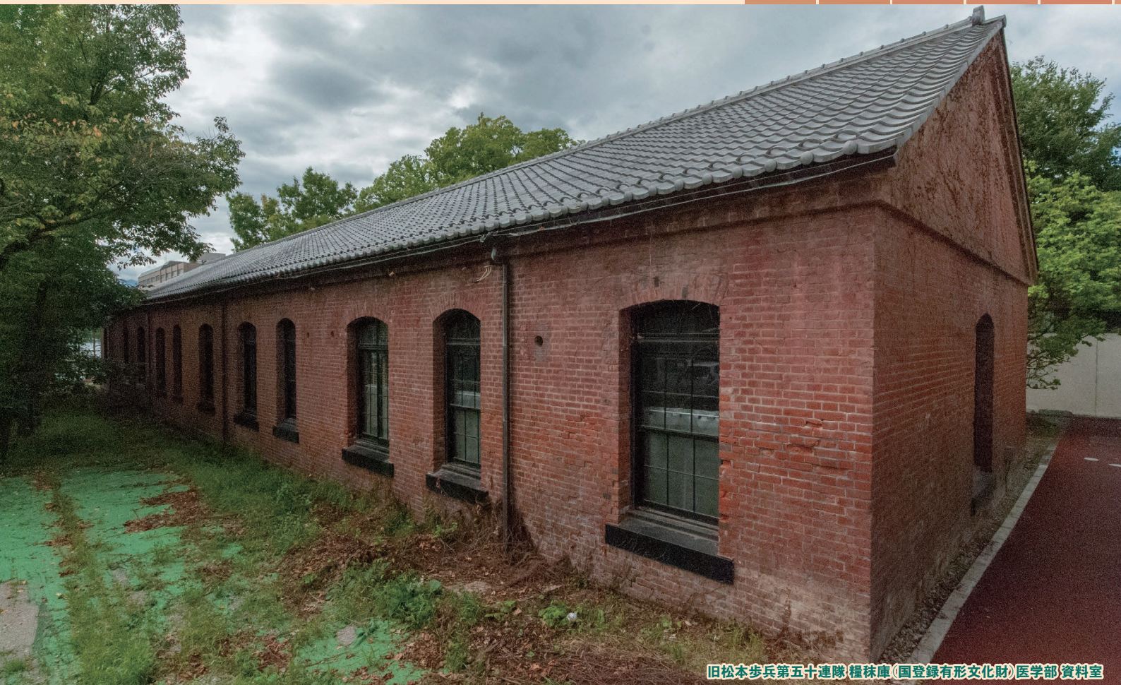
旧松本歩兵第五十連隊糧秣庫(国登録有形文化財)医学部 資料室