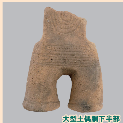
大型土偶胴下半部