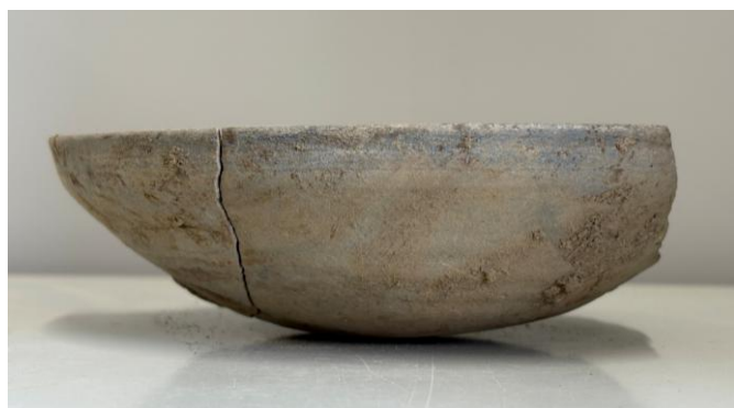
1区から出土した須恵器の坏

調査区東側の1区で、遺構をみつける作業中に須恵器の坏が出土しました。これまで1区では平安時代以降の竪穴建物跡が多く確認されていましたが、今回みつかった須恵器は、その形から古墳時代の終わり頃につくられたものと考えられます。南栗遺跡の集落は、古墳時代の終わり頃から形成されたと考えられているため、今回出土した須恵器は、集落がどのように形成されていたのかを知る手がかりになると期待されます。