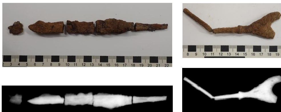
出土した鉄製品（左：刀子、右：鉄鏃）とX線透過画像

今年度の調査でもすでに鉄製品が出土しています。遺物の劣化を防ぐために、出土した鉄製品には保存処理を施していく予定です。