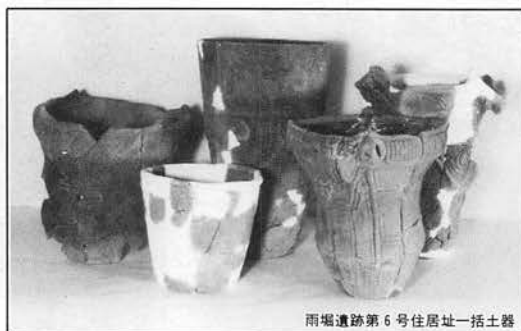
雨場遺跡第6号住居址一括土器

所在地 松本市大字中山3,738番地の1 休館日 水曜日・祝日（日曜日のときは翌日） 12月29日より1月3日 入館料 一般200円 高校生150円 小中学生100円 団体30人以上 一般150円 高校生100円 小中学生80円 交通 松本電鉄バス、中山線中山霊園口下車