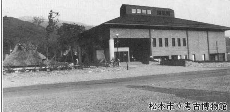
松本市立考古博物館

〔建物の概要〕本館は弘法山古墳や中山古墳群のある松本市の東南の中山丘陵の鞍部にあり、昭和6年より続いた中山考古館を廃し、更に全市的な立場での考古博物館を建設したものである。