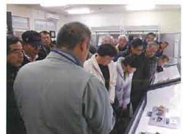
昨年度実施したときの様子