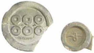
出土した軒瓦（六文銭紋・雁金紋）