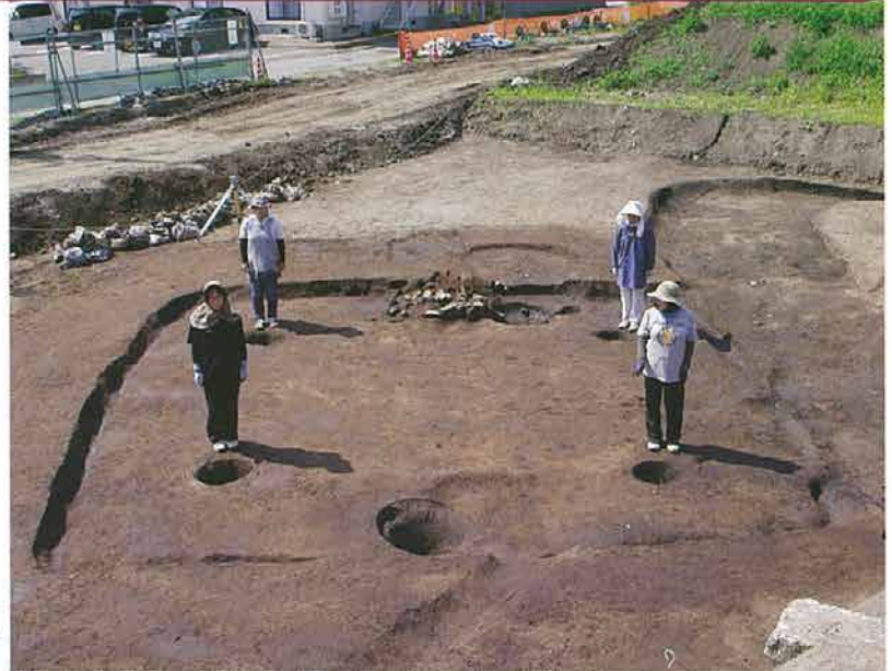
【古墳時代中期の竪穴住居跡】石製模造品とその破片が見つかった。

平成 27 年度の発掘調査で、古墳時代中期の竪穴住居跡床面から石製模造品が見つかった。石製模造品は滑石製で、鏡や勾玉などの形を模した祭祀の道具である。製作時に使用する道具は発見されなかったものの、その際に出る滑石の破片 3,850 点や未成品 172 点、完成品 9 点が見つかった。それらは 2～10mm 程度と非常に小さいもので、石製模造品を製作した人々の技術水準の高さがうかがわれる。今後、石製模造品の製作が行われた可能性を検討していきたい。（長野県埋蔵文化財センター 福井優希）