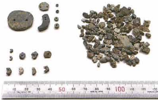
【石製模造品】完成品（左上）、未成品（左下）、製作時の破片（右）