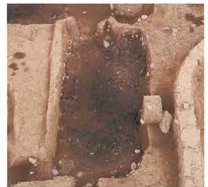
炭焼窯の炭出土状況

高畑遺跡は奈良時代から中世にかけての遺跡である。平安時代に東山道の覚志駅が置かれたとされる芳川地区に所在している。今回の 6 次調査では約 20,000㎡を対象とし、平安時代を中心に 160 軒を超える竪穴住居跡や炭焼窯 3 基などの遺構、皇朝十二銭の一つである「富寿神宝」や緑釉陶器などの遺物を確認した。住居跡の分布域は時期ごとに異なり、集落の中心域は移動していたと考えられる。その他、集落を区画する溝が確認されるなど、当時の集落の様子をうかがうことができた。（松本市教育委員会 小山奈津実）