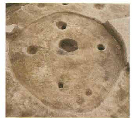
弥生時代竪穴住居跡

田子川の左岸に広がる三才田子遺跡では、弥生時代中期・後期、古墳時代後期、平安時代の竪穴住居跡が見つかった。隣接する田子川右岸の台地上に位置する籠沢遺跡では弥生時代の集落が確認されていなかったが、今回の調査では弥生時代の住居跡が一番多く検出された。左岸の一段下がった場所に弥生時代中期の集落がつけられはじめ、後期にかけて長く営まれていたことがわかった。（長野市埋蔵文化財センター 遠藤恵実子）