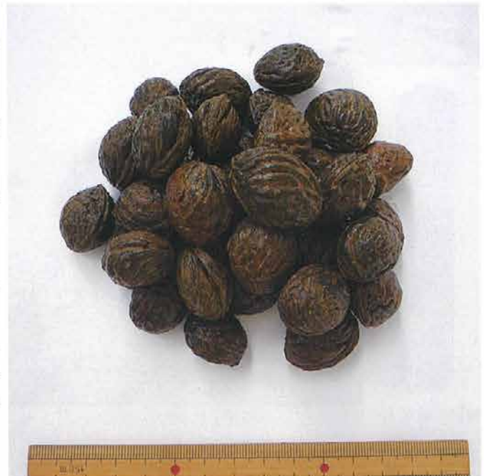
【古代モモの種子】長野市塩崎遺跡群井戸跡（SK2670）出土

井戸は、地表から地下深く細長く掘り下げた穴であるが、まさに現代から古代をつなぐ「窓」でもある。今後とも注目して調査をすすめたい。（長野県埋蔵文化財センター 川崎 保）