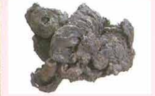
被熱した一分判金（上） 被熱した寛永通宝（下） （ともに本丸末申隅櫓跡出土）