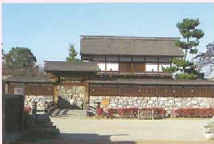
復元された太鼓門