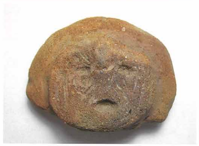
【塩崎遺跡群】(長野市) 弥生時代中期初頭 高さ 4.5cm 線刻で目と口の周り、頬に入れ墨が表現されている。顔の表現は目と口の凹みのみであり、鼻は最初から作られていない。ひんご遺跡の土偶と比較して、つくりは粗雑である。

栄村ひんご遺跡から、縄文時代中期の土偶が出土した。鼻の下をのびした独特の表情をしており、類似品は県内にはなく、新潟県魚沼地方の道尻手遺跡から出土している。一方、長野市塩崎遺跡群からは弥生時代中期の土偶が出土した。弥生時代になると土偶はほとんど作られなくなるが、東日本では土偶形容器（容器形土偶とも。子供用骨蔵器と考えられている）として製作されていることが多い。本例も半円形の髷、顔の入れ墨（黥面）など土偶形容器と同じ表現がされている。どちらも口を開けて何かを語りかけているか、歌を歌っているようにもみえるが、いかがだろうか。（長野県埋蔵文化財センター 片山祐介）