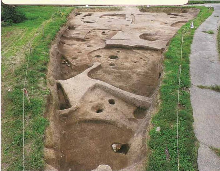
弥生時代・平安時代竪穴住居跡