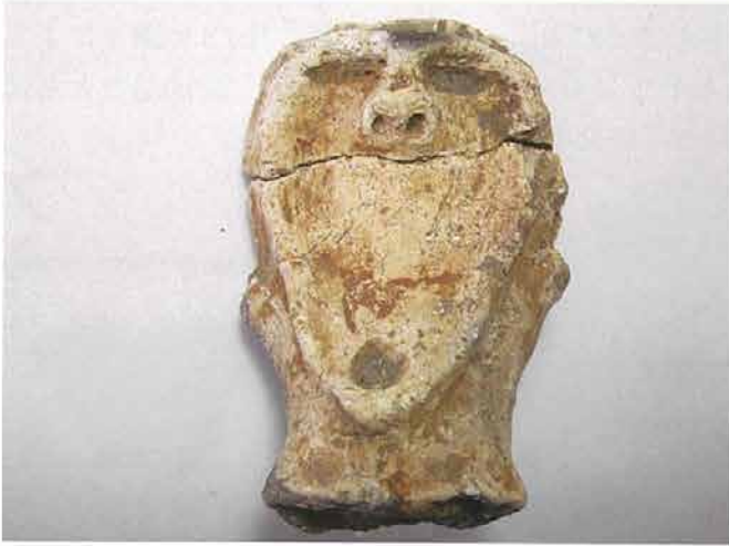
【ひんご遺跡】(栄村) 縄文時代中期後葉 高さ 6.3cm いわゆるハート形土偶の系統と考えられる。顔面は磨かれて成形され、鼻の表現はリアルである。顔面装飾はないが、つくりは丁寧である。白っぽい色調も新潟県内出土のものに近い。