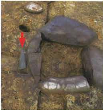
【竪穴住居跡の炉】 炉石の脇から石棒が出土した。