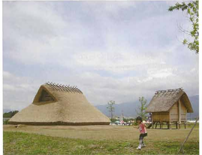
開放感たっぷりの公園で、大昔のムラを探検できるよ（古墳時代ムラ）

また、聞いてみたいことがあったら、併設されたガイダンス棟に立ち寄ってみましょう。