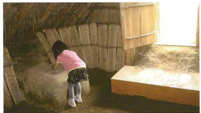
これ、何に使ったの？（平安時代ムラ、復元住居内のカマド）