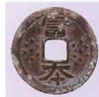
富本銭 日本最古の 流通貨幣