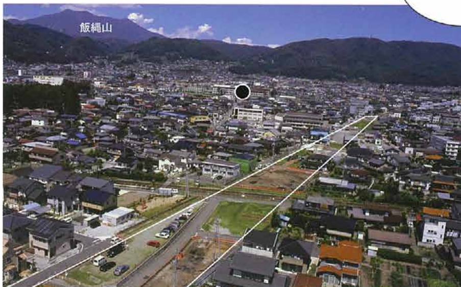
浅川扇状地遺跡群 南からの遠景（白線内が調査地 ●が吉田高校グランド遺跡）