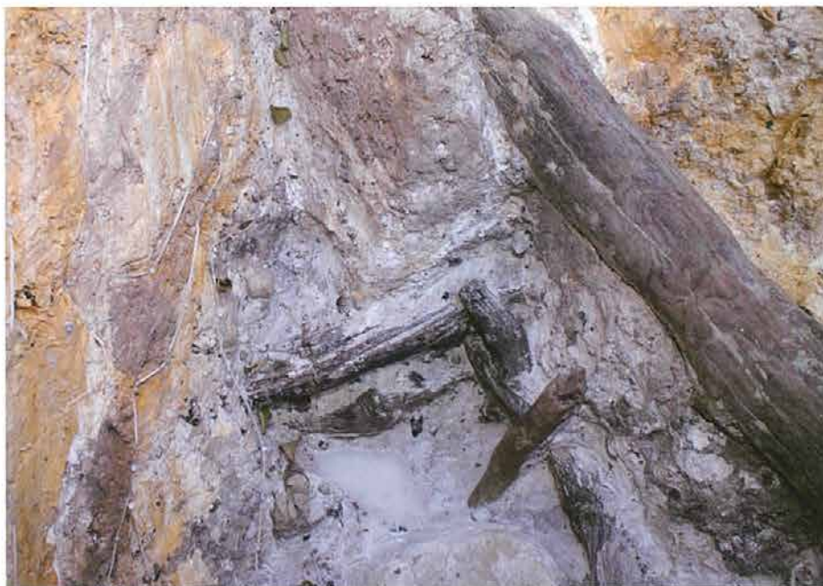
採掘の際の土砂崩れ防止のための木柵

旧地表面の時期は、深鉢形土器の破片が出土し、その土器に付着していたオコゲと地表面上に広が