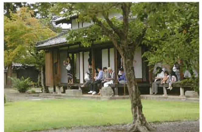
御殿から四季折々のお庭を楽しみ、ホッとひと息しませんか